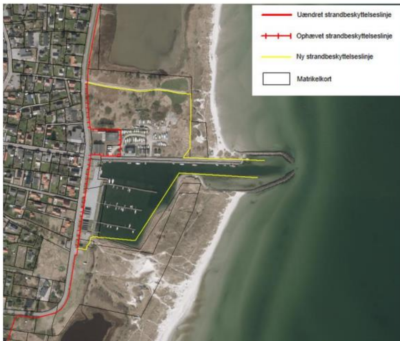
Figur 3. Kortudsnittet viser det nye forløb af strandbeskyttelseslinjen ved Hou Havn som fastlagt af Kystdirektoratet.