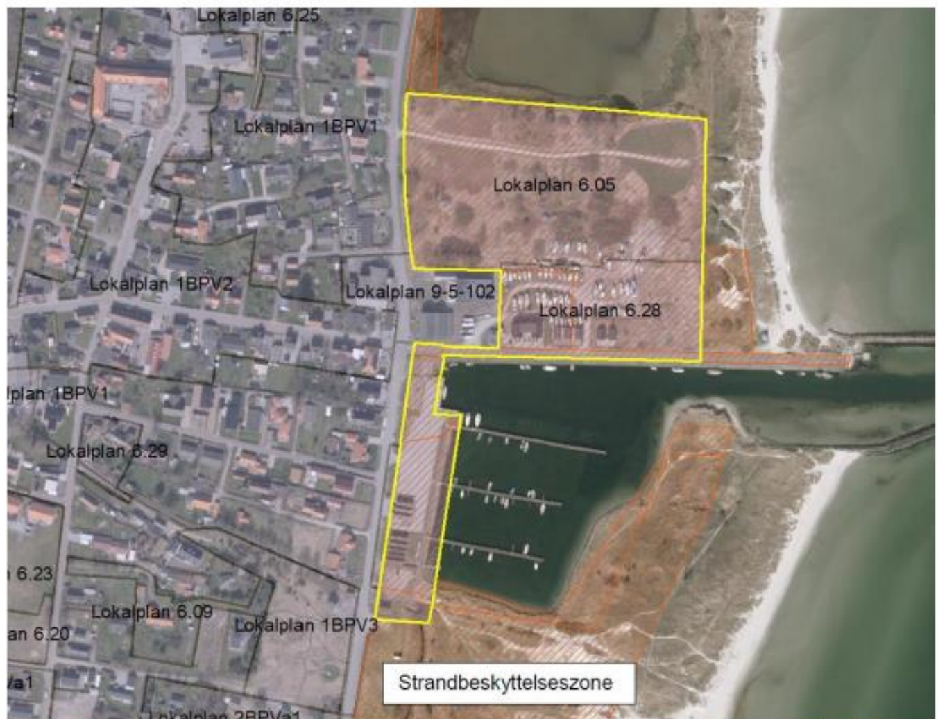
Figur 1. Kortudsnittet viser Aalborg Kommunes forslag til ophævelse af strandbeskyttelseslinjen på og ved Hou Havn. Det ansøgte er markeret med gult område.

Aalborg Kommune har ansøgt om ophævelse af strandbeskyttelseslinjen på arealer på og ved Hou Havn. Se figur 1.